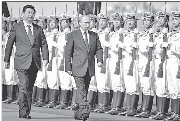
Президент РФ Владимир Путин и Председатель КНР Си Цзиньпин приняли участие в церемонии открытия российско-китайского военно-морского учения «Морское взаимодействие-2014», состоявшегося на военно-морской базе Усуи. Совместное военно-морское учение «Морское взаимодействие-2014» пройдет с 20 по 26 мая в воздушном пространстве и на морской акватории северной ча-

сти Восточно-Китайского моря. Российские силы, участвующие в учении, прибыли в Шанхай 18 мая. В море будут отработаны совместные действия по обороне кораблей на морской стоянке, конвоированию судов, освобождению захваченного судна, обнаружению и опознаванию целей совместной противозушной обороны. Планируются совместные налеты ударов по морским мишеням,