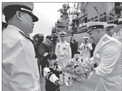
На берегу тихоокеанцев встречали представители командования военно-морских сил Народно-освободительной армии Китая и Военно-Морского Флота Российской Федерации. После осуществления швартовки прямо на пирсе состоялся брифинг руководства предстоящего учения.

Вице-адмирал Тянь Чжун, обращаясь к морякам обеих стран, заявил, что главной особенностью учения станет повышение уровня сложности совместных действий отрядов боевых кораблей в море. Он также отметил, что впервые стороны создадут и будут действовать в составе смешанных отрядов кораблей, которые проведут совместные ракетно-артиллерийские