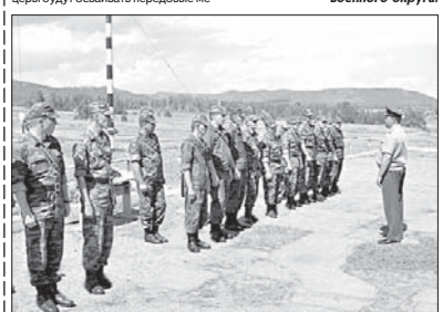
БОЕВАЯ ВАХТА 24 МАЯ 2014 г. 2 СТР. СУББОТА

Пресс-служба Восточного военного округа.