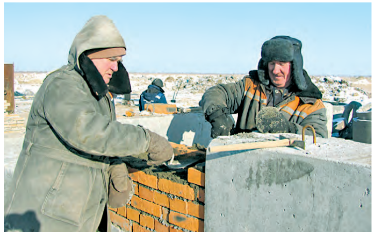
За работой — каменщики

Елена ЧЕРНИКОВА, фото автора и Олега НАГОВИЦЫНА