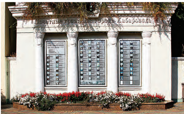
Чье имя появится на доске почета в мае?

за большой вклад в дело подготовки высококвалифицированных кадров, воспитание подрастающего поколения, духовное и нравственное развитие общества, поддержание законности и правопорядка, защиту прав человека и Отечества, личное мужество и героизм.