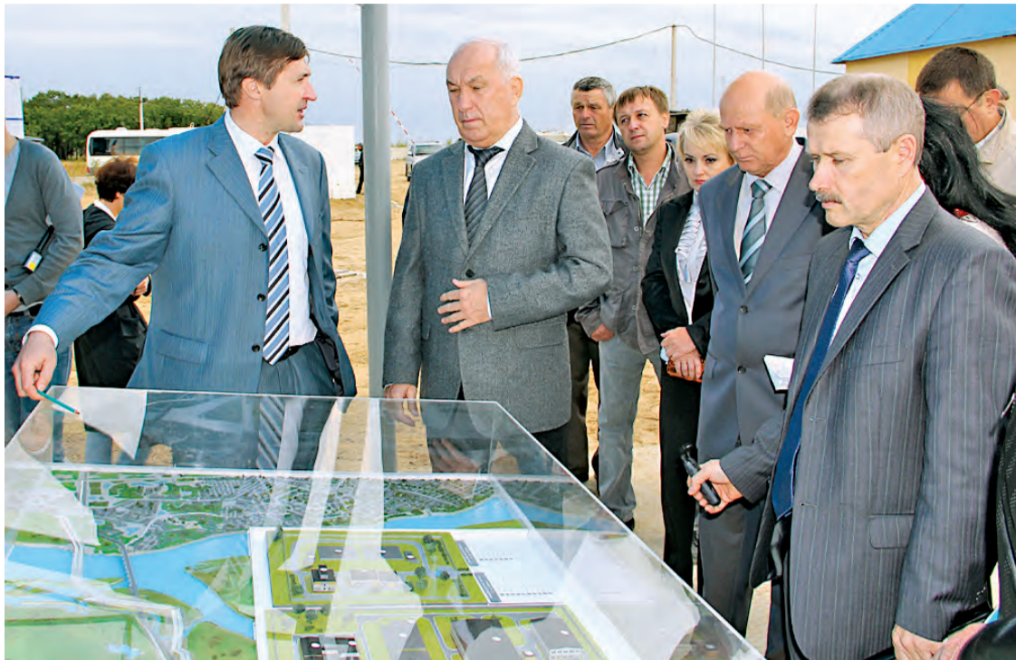
Стройка находится под постоянным контролем властей

Началась стройка в 2000 году. Основные работы велись на территории Еврейской автономии. Кстати, в перспективе Тунгусский водозабор обеспечит водой и жителей Смидовичского района, на территории которого строится комплекс, правительство области уже выразило такое пожелание. Месторождение находится недалеко от поселка Владимировка, откуда