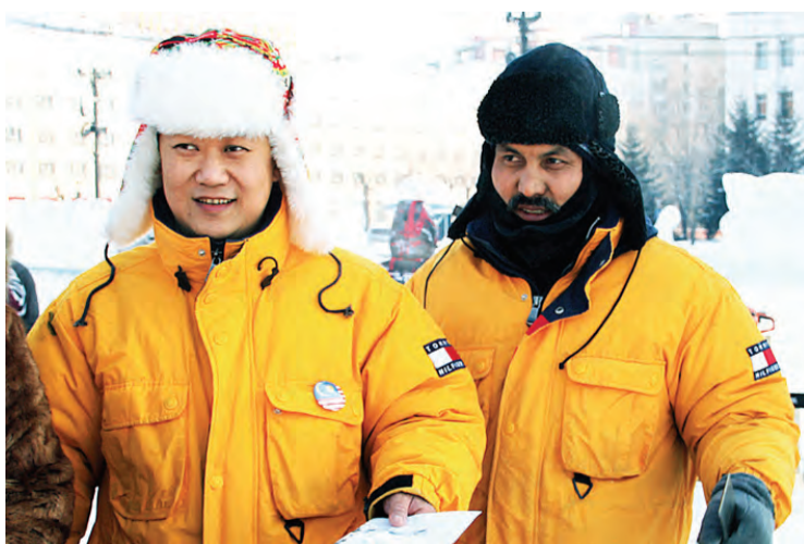
Скульпторы из Малайзии

или сахара. Одна наша скульптура, выполненная в форме 5-метровой сабли, даже попала в национальную книгу рекордов.