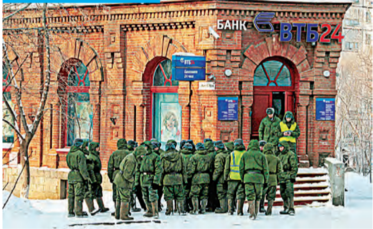
Служба идет — деньги каплют.