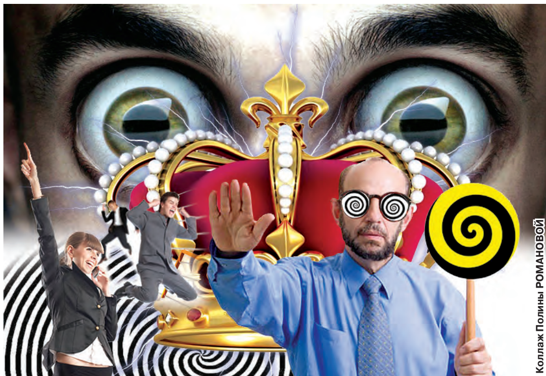
Коллаж Полины РОМАНОВОЙ

— Пикап разработан для неуверенных в себе парней. Они настолько свято верят, что он им поможет, что и результат получается стопроцентный — «жертва»