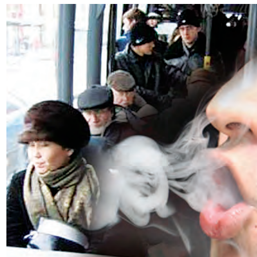
Подготовила Ирина ТРОЦЕНКО

Хотите обсудить материал? news@khab-vesti.ru