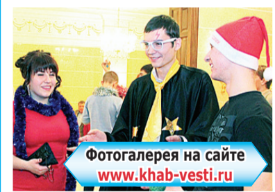
Фотогалерея на сайте www.khab-vesti.ru