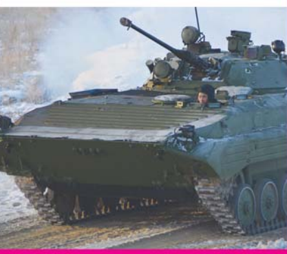
Окончание на 2-й стр.

Его участниками стали командиры мотострелковых, танковых, разведывательных, инженерно-са-