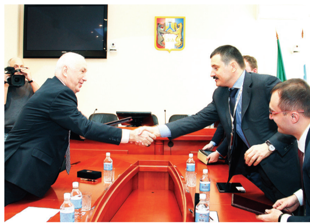
центная привлекательность», — отметил мэр Хабаровска Александр Соколов.

Основной упор будет сделан на разработке программ финансирования модернизации и надежного функционирования систем жизнеобеспечения и сферы жилищно-коммунального хозяйства Хабаровска. «При выборе финансового учреждения для нас немаловажную роль играет долгосрочность выдачи заемных средств и про-