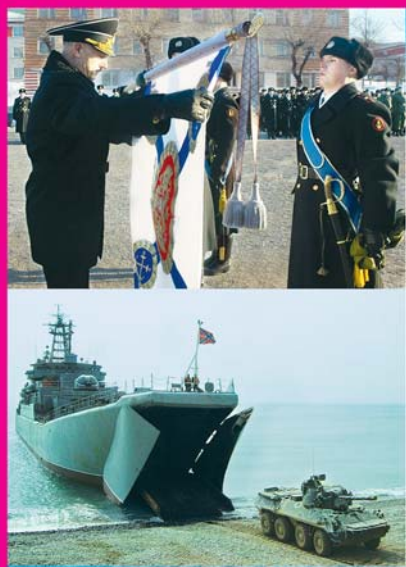
27 ноября - День морской пехоты