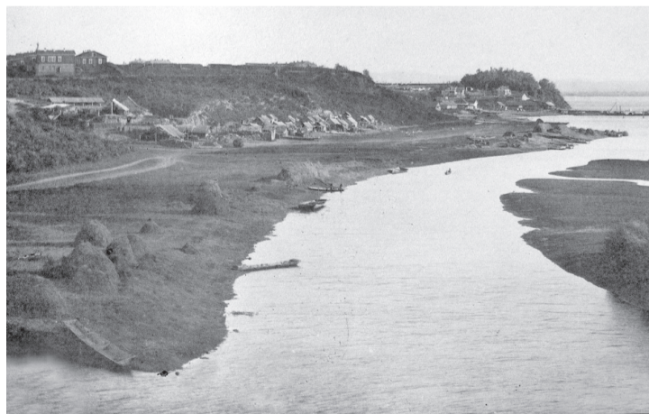
Речка Лагерная и Амурский утес (1898 г.). Сюда во второй половине 1940-х годов были перемещены многие тысячи тонн грунта