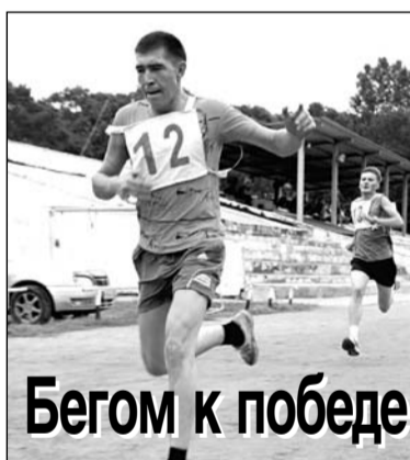
Бегом к победе

Материалы рубрики «Спорт» подготовила Светлана ПОГРЕБНАЯ.