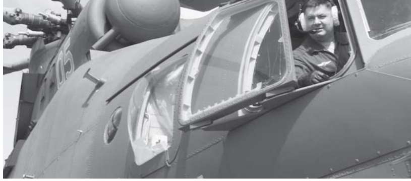
На снимке: полковник Игорь Зайцев.

- Всё проходило в штатном режиме. Решали поставленные задачи - и всё. Так и напишите!