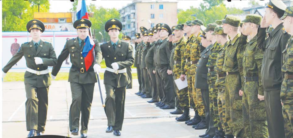
1 июня в войсках ВВО начался летний период обучения

Отмеченные им цифры значили, что заявленный китай-