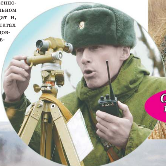
Состязания по полевой выучке