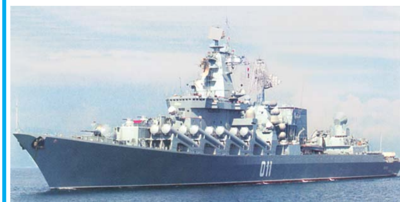
На снимке: флагман Тихоокеанского флота - гвардейский ракетный крейсер «Варяг». Константин ЛОБКОВ. Фото из архива редакции.

В условленном месте к отряду присоединились БПК «Адмирал Трибуц», танкер «Печенга» и буксир «МВ-37» следующие из Аденского залива. Затем вновь сформированный отряд кораблей взял курс на Циндао. Замысловым предстоящим учениям предусматриваются различные сценарии совместных действий флотов обеих стран как на антитеррористическую тематику. По окончании всех запланированных этапов учений на акватории Жёлтого моря состоится морской парад.