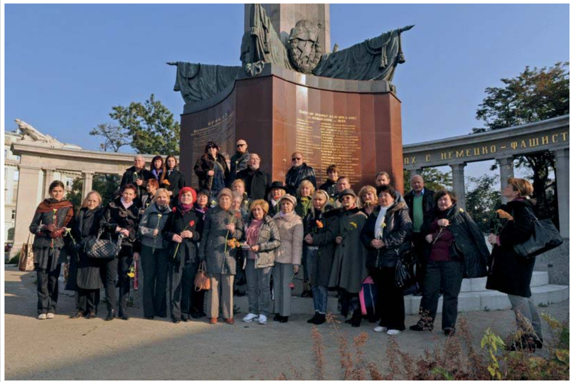
Общий снимок участников фестиваля у памятника русскому солдату

Материал Виты Пшеничной «О, Wien, Wien!..», посвящённый Международному фестивалю «Литературная Вена - 2011», читайте на с. 3