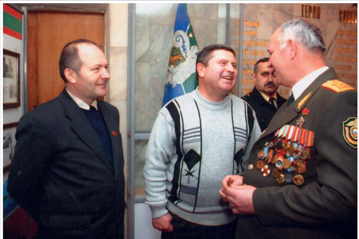
На встрече воинов-интернационалистов

Материал Василя Самохотина «...Эти парни вернулись из боя» читайте на с. 14