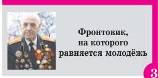
Фронтвик, на которого равняется молодёжь