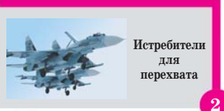
Истребители для перехвата