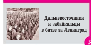
Дальневосточники и забайкальцы в битве за Ленинград