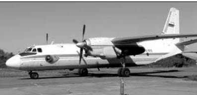
Флотских пассажиров и грузов, но и выполняет боевые задачи: крылатые Аны нередко поднимаются в небо с авианосцами-десантниками на борту. Были ли подобные самолето-вылеты в году удачливей? Кей экипаж особо отличился в этих полетах?

В этом году экипажи корабельных авиационных транспортников. На связь вышел заместитель командира транспортной эскадрильи по работе с личным составом штурман 1-го класса майор Константин ПРИТЧИН.