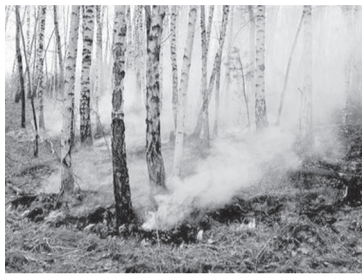
Уважаемые жители Кавалеровского района!

С наступлением осеннее – зимнего периода начинаются и природные пожары, особенно лесные.