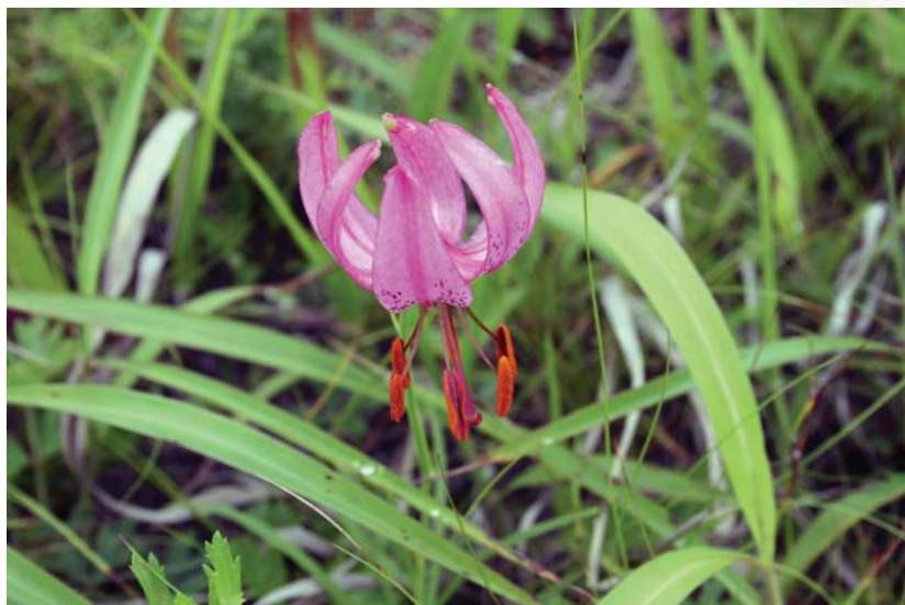
Маленькое чудо бухты Спасения!

Необыкновенные и ещё сравнительно нетронутые места полуострова Гамова, где находится самая южная точка России, единственный в стране морской заповедник, а также заповедники, где обитают барсы, леопарды, уссурийские тигры – всему живому требуется защита... от человека. Да, именно от человека. Такова, увы, реальность сегодняшнего дня.