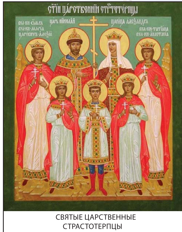
СВЯТЫЕ ЦАРСТВЕННЫЕ СТРАТОТЕРПЦЫ

В книге всемирно известного учёного Владимира Ивановича Даля «Разыскание о убиении евреями христианских младенцев и употреблении крови их» (Санкт-Петербург, 1844) читаем об этом следующее: «В 1454 году в Вене казнено несколько евреев за то,