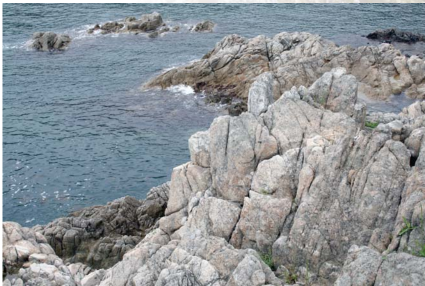
Морские красоты бухты Теляковского

Возвращаясь к непередаваемым красотам при-