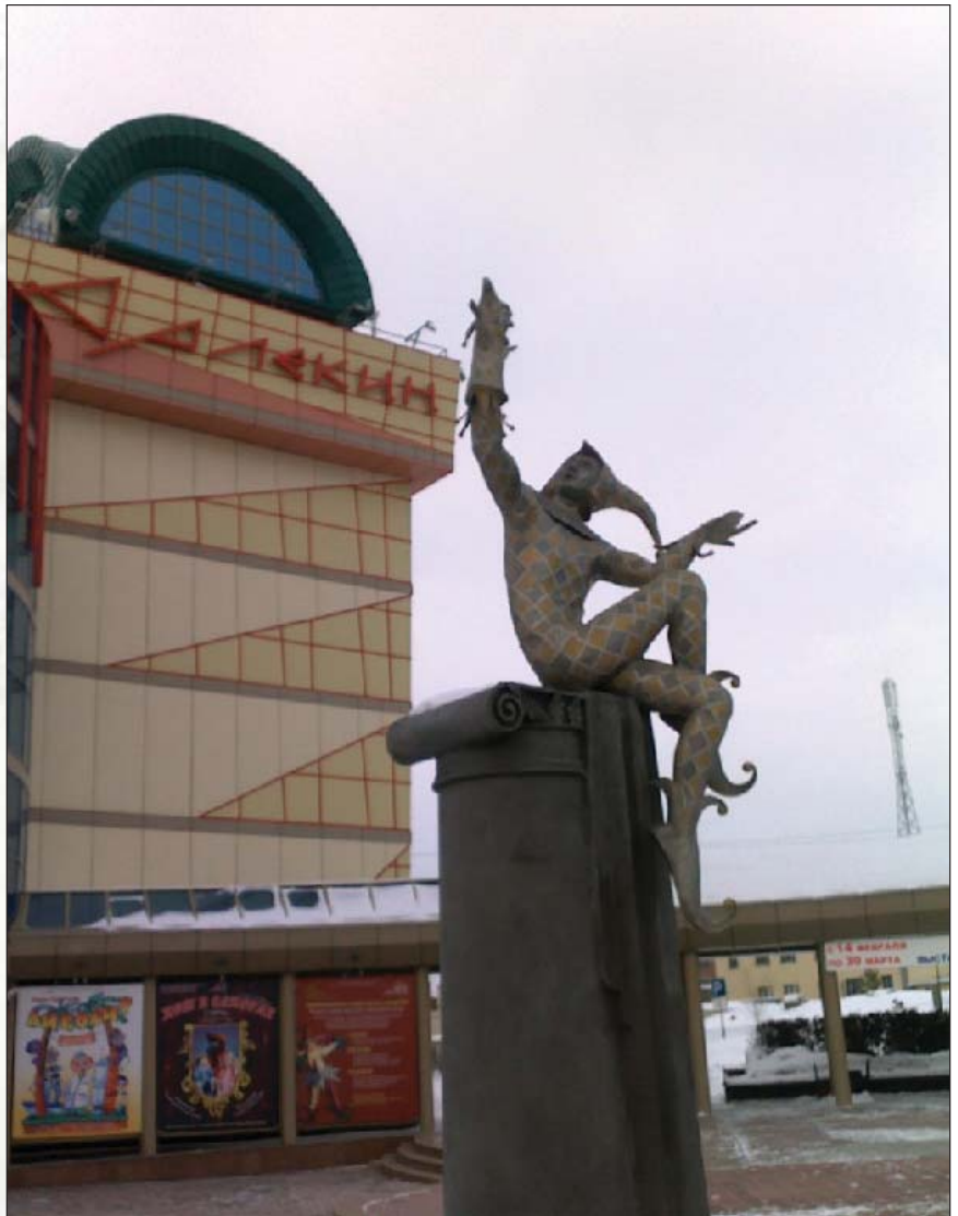
Театр кукол «Арлекин». Фото Анастасии Антоновой, г. Омск

Ночью мы спустились с сыном в лагерь. Они дрыгли, как суслики, но у меня не поднялись руки... Остаётся одно: повторить уже раз пройденное. Смогу ли я справиться с этим кораблём? Но иного выхода нет. Завтра или никогда. Только бы не испортилась погода, иначе они заберутся ночевать в корабль. Выдержит ли маленькая Ли́ла?..».