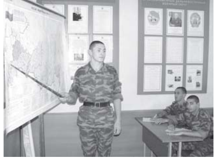
15. Выполнение требований безопасности военной службы в ходе ведения караульной и внутренней служб, боевого дежурства.