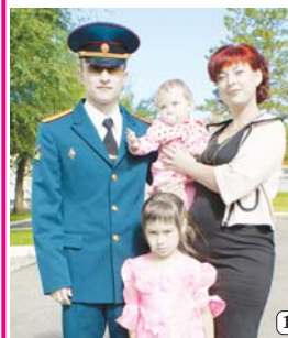
Мы приехали на бал