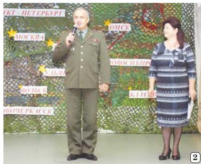
главному человеку в соединении.

ровалось первоначально, должен был состояться в стенах Волочаевского Дома офицеров. Но потом мероприятие почему-то переименовано. Однако жёны молодых офицеров всё равно называли его балом, так давайте же и мы считать его таковым.