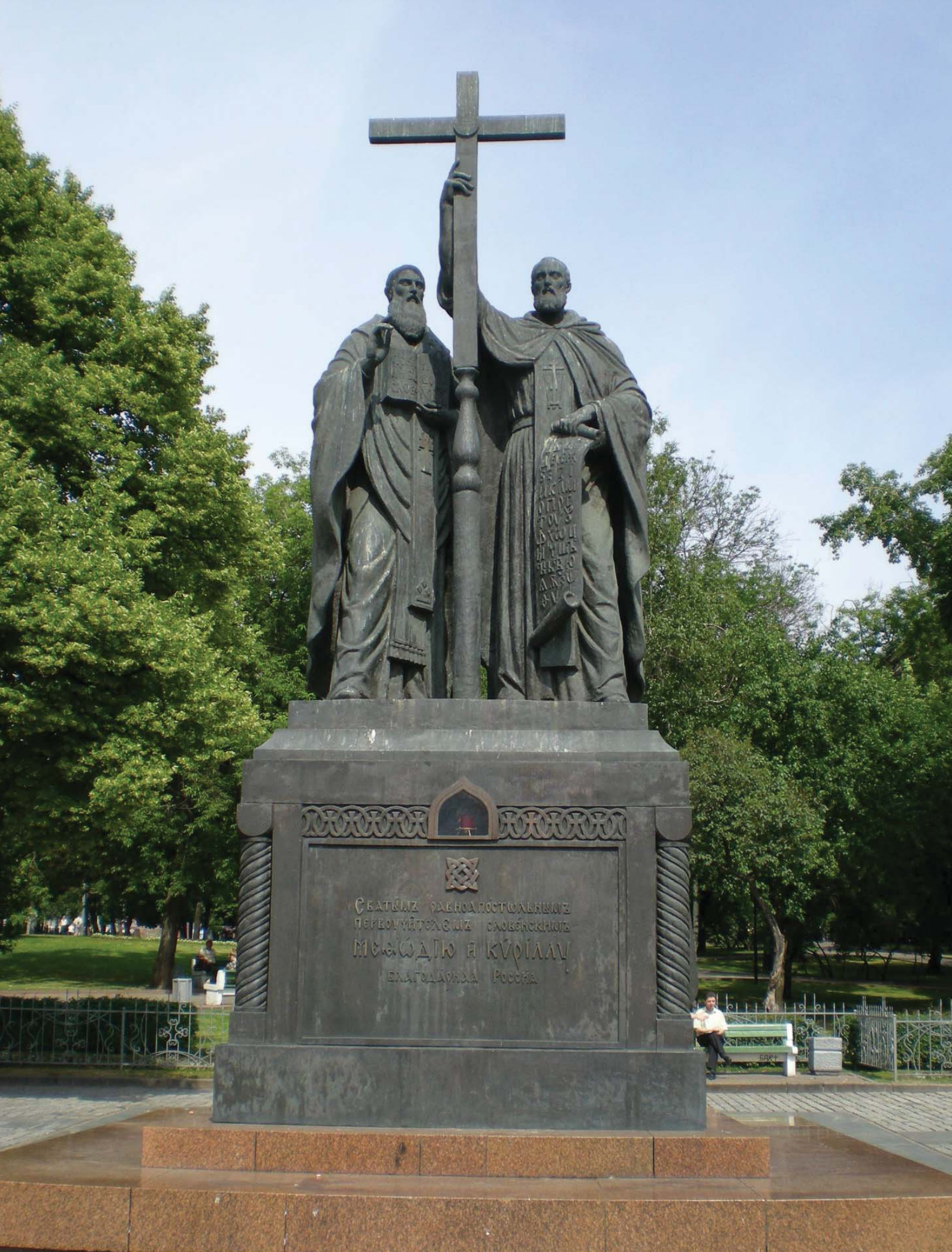
Памятник Святым равноапостольным Мефодию и Кириллу (г. Москва).