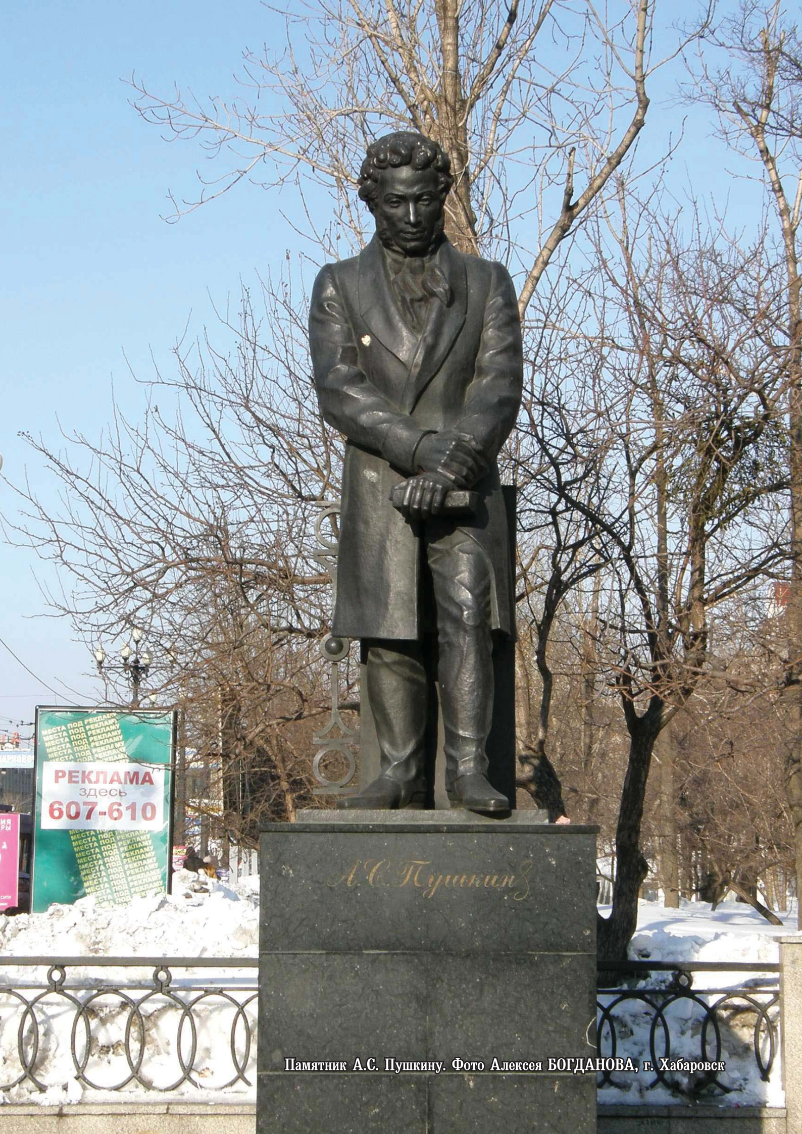
Памятник А.С. Пушкину. Фото Алексея БОГДАНОВА, г. Хабаровск