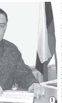
Служащий воеводно на тягаче и три компьютерных тренажера для подготовки личного состава по огневой подготовке. Будем оборудовать на базе аэродрома еще один класс для изучения материальной части МТ-1В.

- Обучение поставлено без перекосов в сторону какой-либо одной дисциплины. Оно начинается с теоретической подготовки по изучению материальной базы в пункте постоянной дислокации. Школа располагает собственным учебным корпусом на двадцать комнат. Оборудован компьютерной техникой. Оборудован только плакатная база, но и наглядные пособия по различным дисциплинам - постоянно совершенствуются. В этом году мы получили два тренажера для обучения военно-