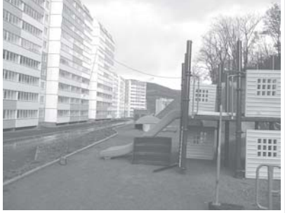
По данным управления, в очереди на постоянное жилье сегодня находится почти 9,5 тысячи военнослужащих. Из них 72,1% изъявили желание после увольнения из рядов Вооруженных сил РФ остаться на Дальнем Востоке.

В колонне должны быть выстроены в линию все подразделения, включая подразделения связи, подразделения обеспечения, подразделения тыла и подразделения охраны. В колонне должны быть выстроены в линию все подразделения, включая подразделения связи, подразделения обеспечения, подразделения тыла и подразделения охраны.