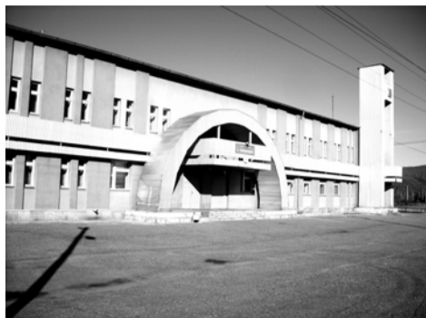
Вокзал п. Олёкма