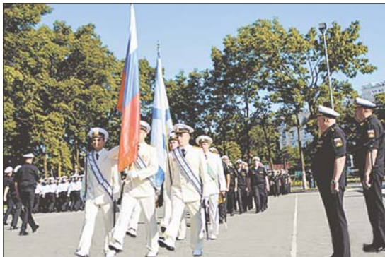
Фото Ильдуса ГИЛЯЗУТДИНОВА.

Пресс-служба Восточного военного округа.