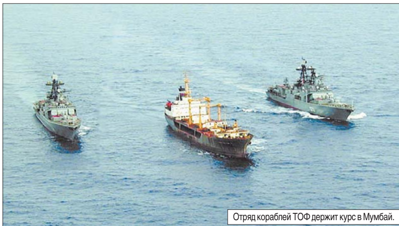
Отряд кораблей ТОФ держит курс в Мумбаи.