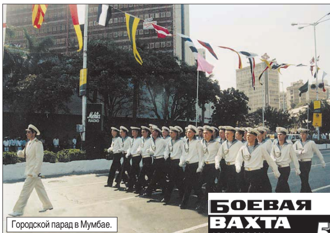
Городской парад в Мумбае.