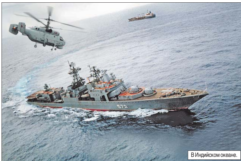
В Индийском океане.

Капитан 2 ранга запаса Владислав ДУБИНА, участник индийского похода.