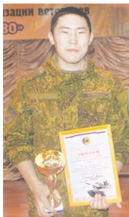
Они никого не оставили равнодушными.

- Подобные песенные конкурсы - это то, с чего начинается любовь к Родине. Сегодня участники исполнили песни, которые понимают люди, много пережившие. Это произведения с глубоким смыс-