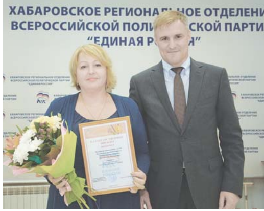
ХАБАРОВСКОЕ РЕГИОНАЛЬНОЕ ОТДЕЛЕНИЕ ВСЕРОССИЙСКОЙ ПОЛИТИЧЕСКОЙ ПАРТИИ «ЕДИНАЯ РОССИЯ»