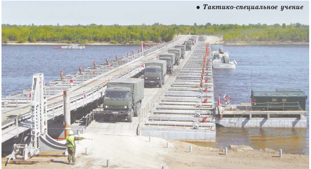
● Тактико-специальное учение

Следует сразу отметить, что бригада под командованием полковника Виталия Климовича имеет сравнительно небольшой состав. В неё входят всего два батальона: путевой и понтонно-