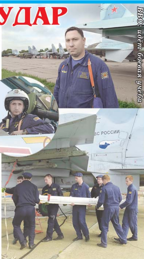
ВВО: идёт боевая учёба