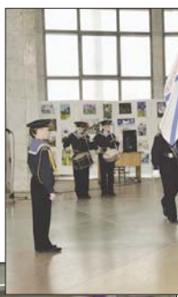
Российского флота и родного края.

Юни флотилии проходят комплексное обучение по направлениям начальной военной, морской, стрельковой, медицинской подготовки, спортивной радиопеленгации, скоростной радиотелеграфии. Они изучают историю