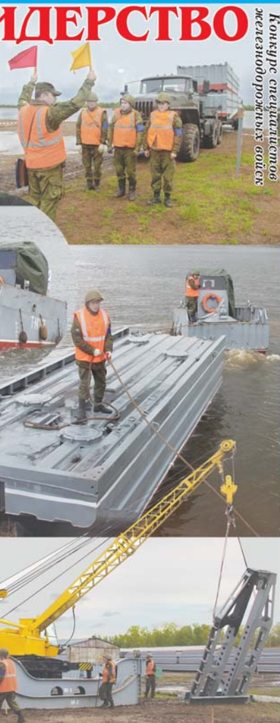
Конкурс специалистов железнодорожных войск