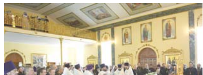
Верующими военнослужащими право- славного и мусульманского вероиспо- ведения».

Здесь были подведены итоги ра- боты штатного военного духовенства по работе с личным составом ВС РФ за период с 1 января 2014 по 30 мая 2015 г., обобщён опыт практи-