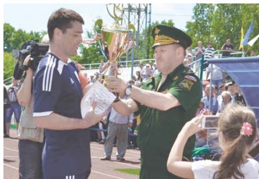
чемпионате Дальнего Востока и первенстве Амурской области приходит много горожан. Вот и сейчас на каждой встрече стадион «Амурсельмаш»

был забит до отказа. За время турнира болельщик за своих земляков пришел более шести тысяч болельщиков! Среди них было и немало военнослужащих местного гарнизона.