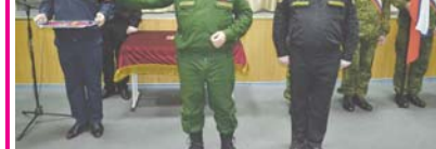
учебы высокие показатели и призвал к дальнейшему повышению профессионального мастерства.

Обращаясь к морским пехотинцам, генерал-полковник Сергей Суровкин отметил продемонстрированные ими в рамках зимней Суворовской