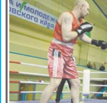
Победитель соревнований в категории до 52 кг по итогам трех раундов победой одержал мастер спорта...