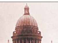
Также в коллекции представлены редкие материалы военной поры. Например, подлинный лист, в котором нашли отражение и социальная помощь, и духовная поддержка воевавших солдат.