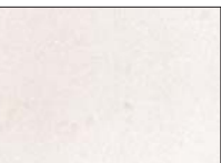
Также в коллекции представлены редкие материалы военной поры. Например, подлинный лист, в котором нашли отражение и социальная помощь, и духовная поддержка воевавших солдат.