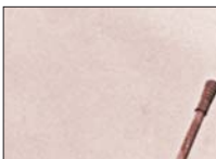
В коллекции представлены редкие материалы военной поры. Например, подлинный лист, в котором нашли отражение и социальная помощь, и духовная поддержка воевавших солдат.

Президентская библиотека оцифровала свыше 350 плакатов времён Великой Отечественной войны, вышедших в разных городах Советского Союза. Раритеты 1941-1945 гг., служившие борьбе с фашизмом, поступили из ФГБНУ «Научная библиотека Российской Федерации».