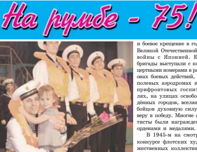
В Дальневосточном регионе нет такого театра, где бы не побывал этот творческий коллектив со своими концертами.

12 декабря ансамбль песни и пляски ТОФ дал юбилейный концерт на сцене Приморского театра оперы и балета