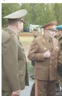
Главными критериями составления заявки являются точность в стрельбе из танкового вооружения, скорость и маневрирование на сложной трассе.

И всё же главным событием стала конкурсная по полковой системе «Танковый биатлон». Если в начале прошлого года инициатива министра обороны РФ генерала армии Сергея Шойгу могла показаться диковиной, то в 2014 году благодаря активной работе Министерства обороны это действо уже привычно.