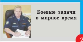
Боевые задачи в мирное время