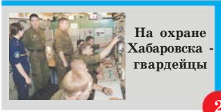
На охране Хабаровска - гвардейцы