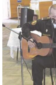
Выставка-конкурс предметов прикладного творчества

Конкурс проводился в нескольких воинских формированиях. Поэтому мы хотели показать, с помощью каких компонентов можно сделать наш рацион праздничным и в то же время полезным.