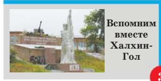
Вспомним вместе Халхин-Гол