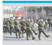
На нас будет город смотреть!