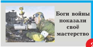
Боги войны показали своё мастерство