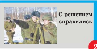
С решением справились