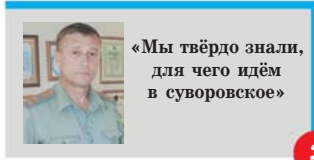
«Мы твёрдо знали, для чего идём в суворовское»