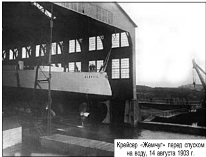
Крейсер «Жемчуг» перед спуском на воду, 14 августа 1903 г.

Мы продолжаем публикацию материалов о кораблях Сибирской флотилии - участниках Первой мировой войны. Очередной корабль в исторической эскадре - крейсер «Жемчуг». У него славная, яркая, но в то же время трагическая судьба. Члены экипажа корабля, не щадя своей жизни, мужественно сражались с врагом, до конца выполнив свой воинский долг.