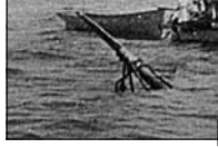
Место гибели крейсера в гавани Пенанга.

ра в проход, по-видимому, не существовало. Два других французских миноносца стояли у острова Пенангши, у стенки. D'Yerville также перебрала машины. Таково было положение дел в Пенанге, когда ок-