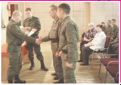
ВВО - день за днём