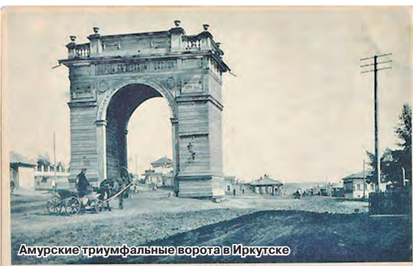
Амурские триумфальные ворота в Иркутске