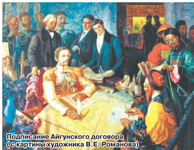
Подписание Айгунского договора (с картины художника В.Е. Романова)