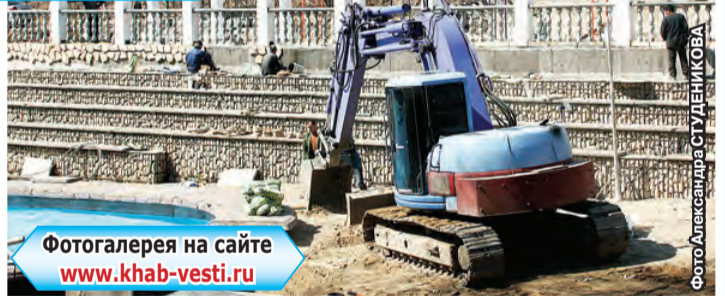
Фотогалерея на сайте www.khab-vesti.ru