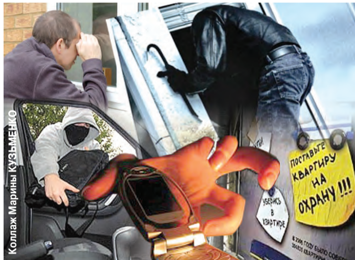
Коллаж Марины Кузьменко

Раньше их именовали форточниками. Деревянные советские окна усложняли жизнь любителям легкой наживы — попробуй-ка просочись в небольшой проем! Эпоху пластиковых окон квартирные вору восприняли с радостью: что может быть проще — вынуть москитную сетку и забраться внутрь! Теперь «оконщикам» необязательно