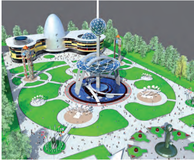
Фрагмент одного из проектов реконструкции парка Гагарина

Завершаются работы над проектом реконструкции парка имени Гагарина.