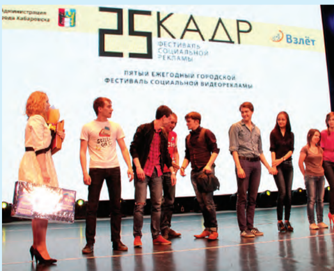
Подробнее о фестивале «25 кадр» — в специальном выпуске «Добрый город» 22 мая

Ирина ТРОЦЕНКО