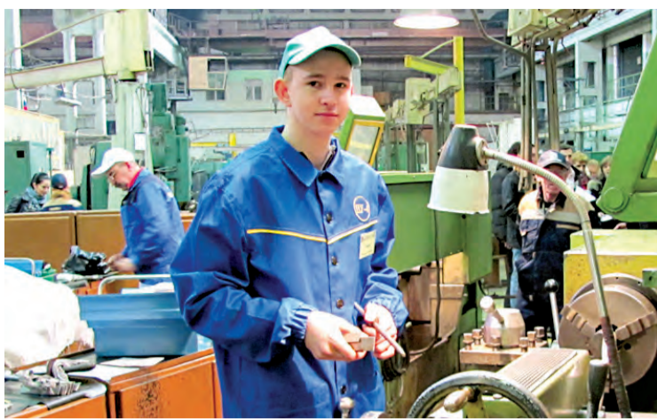
В Хабаровском крае 11 учреждений начального профессионального образования, в которых 4,2 тысячи учащихся, 30 учреждений среднего профессионального образования с контингентом учащихся 23,6 тысячи человек и 27 вузов, где 76,5 тысячи студентов. В 2012 году осуществлялась подготовка кадров по 225 специальностям высшего и 105 среднего профессионального образования.