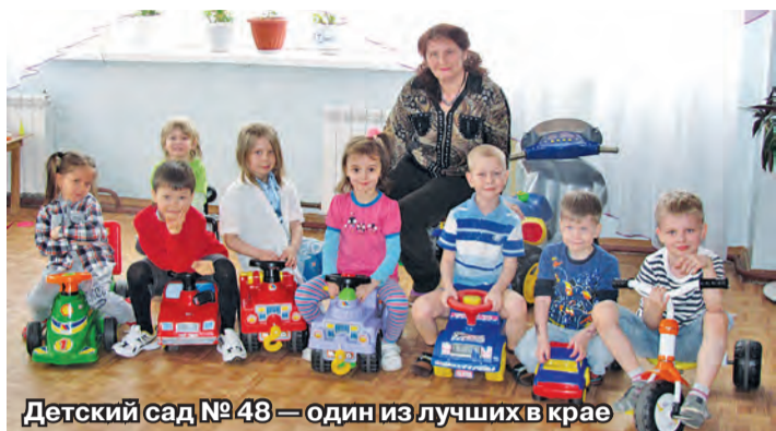
Детский сад № 48 — один из лучших в крае

пании «Жилсервис 7» порой сводятся на нет. Березовка расположена на равнине, что, казалось бы, не должно создавать проблем с дорогами. Но во время таяния снега и проливных дождей воде некуда деваться, поэтому она уже сейчас потекла в подвалы многоэтажек, а ливневой канализации здесь никогда не было. Это сложная проблема, и, чтобы ее решить, нужны многомиллионные затраты.