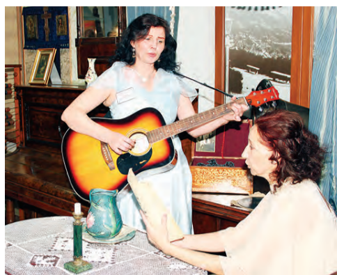
честь сотрудники музея под гитару исполняют ее любимую песню «Белеет парус одинокий».