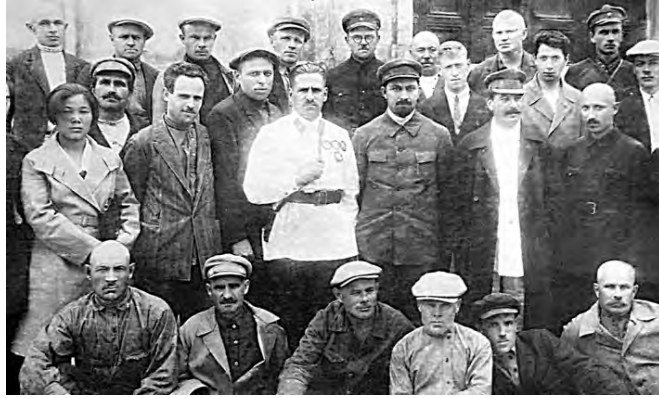
В.К. Блюхер в белом мундире среди соратников

ний Восток пришлось на конец беспокойных двадцатых годов и было связано с решением объединить войска в Особую Дальневосточную армию. Она достойно себя показала, когда белогвардейские отряды и китайские регулярные части перешли советско-китайскую границу недалеко от села Полтавка. А также в районе Имана (ныне Дальнереченск), где нападению подверглись пограничные дозоры. Командование ОДВА нанесло ответный удар. Операция, разработанная при личном участии Блюхера, проходила у места впадения Сунгари в Амур, где располагалась крепость Лахасусу. Корабли Амурской военной флотилии, полки 2-й Приамурской дивизии при поддержке с воздуха и пограничников продемонстрировали врагу свою силу и мощь. 22 декабря 1929 года в Хабаровске подписали соглашение между СССР и Китаем, что означало ликвидацию конфликта на КВЖД.