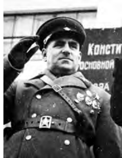
В.К. Блюхер на параде в Хабаровске 7 ноября 1937 г.