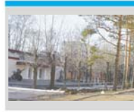
Аллея памяти маршала Петрова