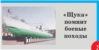
«Щука» помнит боевые походы