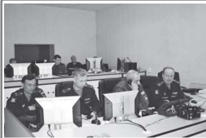
Каким образом организована учебно-боевая работа частей и соединений, не участвующих непосредственно в практических пусках ракет?

Безопасность в личном составе частей и соединений на этапе подготовки к практическим пускам ракет строится по типовому наряду. После приобретения зенитного ракетного дивизиона на полковой содаты, сержанты и офицеры осматривают технику и начинают готовить её к боевой работе. Мэри изучают боевые документы при проведении стрельб, требования руководящих документов, особенности применения зенитных ракетных комплексов на их родной местности, затрудились ведение разведки целей и их поражение. После этого каждый участник тактического учения из состава зенитных ракетных дивизионов сдает экзамен на допуск к боевым стрельбам.