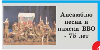
Ансамблю песни и пляски ВВО - 75 лет