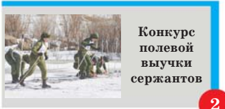
Конкурс полевой выучки сержантов